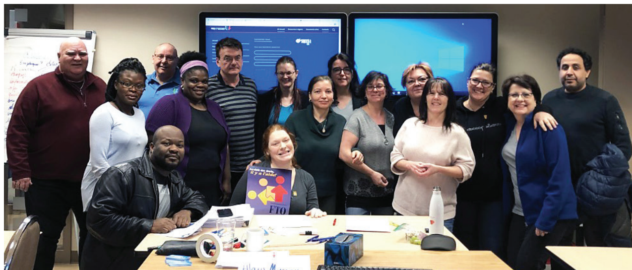
Formation DS hiver 2020 SQEES