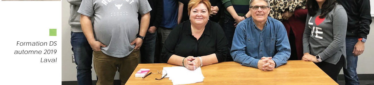
Formation DS automne 2019 Laval